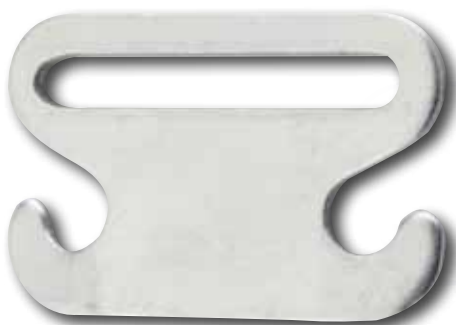
Ancorina tipo grande / Big anchor