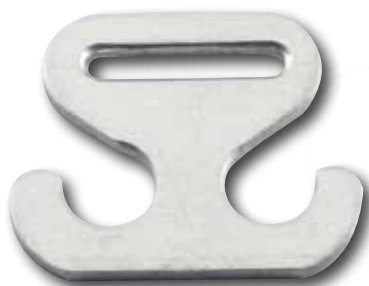
Ancorina tipo piccolo / Small anchor

ancorina tipo grande / big anchor materiale/material: Al 1050 H18 (alluminio/aluminum) spessore/thickness 2 mm misura/dimension: Ø asola/hole 40 x 3 mm peso/weight: 4.80 g