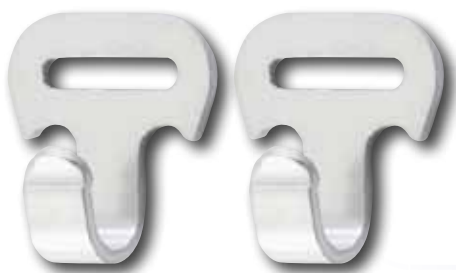
Gancetti con asola / Hooks with hole

ancorina tipo piccolo / small anchor materiale/material: Al 1050 H18 (alluminio/aluminum) spessore/thickness 2 mm misura/dimension: Ø asola/hole 17 x 3 mm peso/weight: 2.40 g